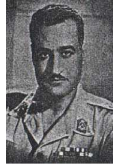
جمال عبد الناصر